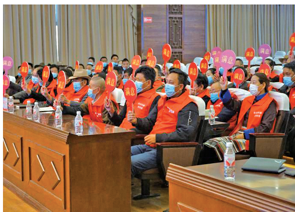
阳光问廉现场问廉团举牌评议被问廉单位

【警示教育】 深化廉政文化活动，筑牢思想防线。一是坚持把学习《党章》《准则》《条例》和习近平总书记系列讲话精神纳入全县党员干部教育中。二是坚持在干部各类培训中开设廉政教育课程，为乡、村干部、入党积极分子培训班讲廉政课。三是深化“廉政教育大讲堂”活动，全县副县级以上领导干部深入联系乡镇和部门开展专题讲党课活动。四是强化警示教育。向县级领导干部发放《忏悔实录 II》，并收集县级领导干部学习心得；分批次组织全县党员干部观看《利剑出鞘》专题片；全年召开警示教育大会 6 次。五是深化廉政文化建设，打造甘孜州最长的藏汉双语“廉政文化”长廊，长约 400 余米。举办“阳光问廉”活动 1 期，达到“红红脸、出出汗”的警示效果。