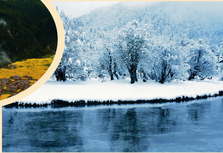
➤ 银装素裹的亚丁冰雪世界