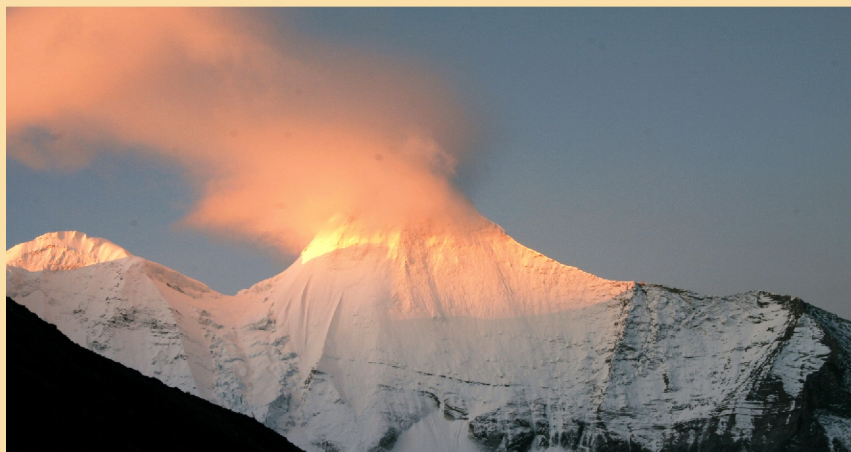
亚丁「三怙主」雪山之夏诺多吉、仙乃日、央迈勇